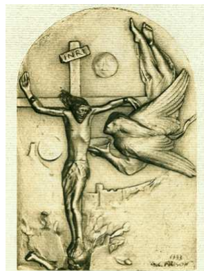
VIA CRUCIS Il sentiero della vita

La diocesi di Padova lancia per giovani dai 18 ai 35 un'iniziativa intitolata "L'Eccomi della Chiesa" che consiste nel vivere un'esperienza di gruppo all'interno della chiesa locale (pellegrinaggio, cammino, viaggio o altro evento da inventare) che aiuti i giovani a chiedersi, come Maria, "Perché e per chi sono?", come via per capire "Chi sono?". L'esperienza avrà una fase di esposizione e di condivisione col vescovo Claudio a fine estate.