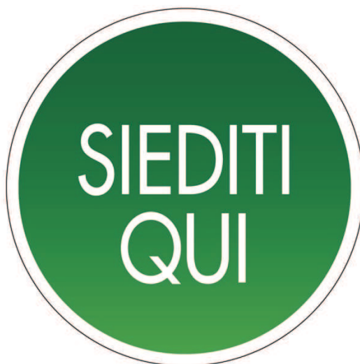
Figura 1 "Bollino segna posto a sedere" (diametro 8/9 cm)