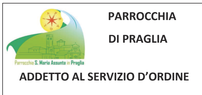
Figura 2 "Cartellino di riconoscimento" (dimensioni 9 x 5 cm)